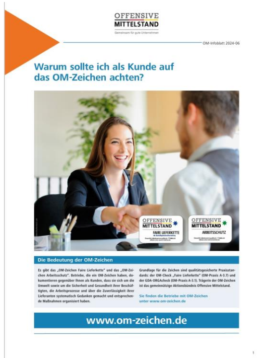
Infoblatt für Kunden der OM-Zeichen-Betriebe