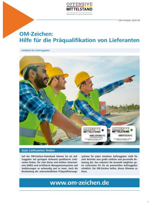
Infoblatt für Auftraggeber