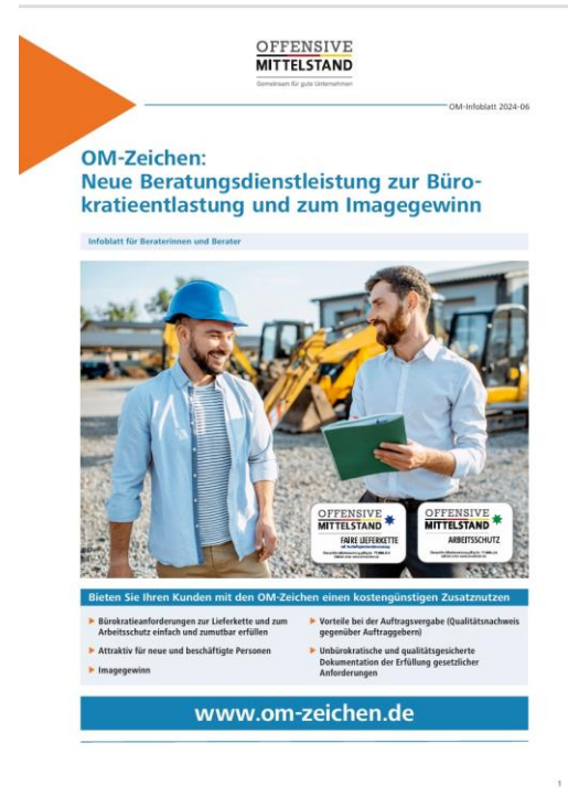
Infoblatt für Beratende