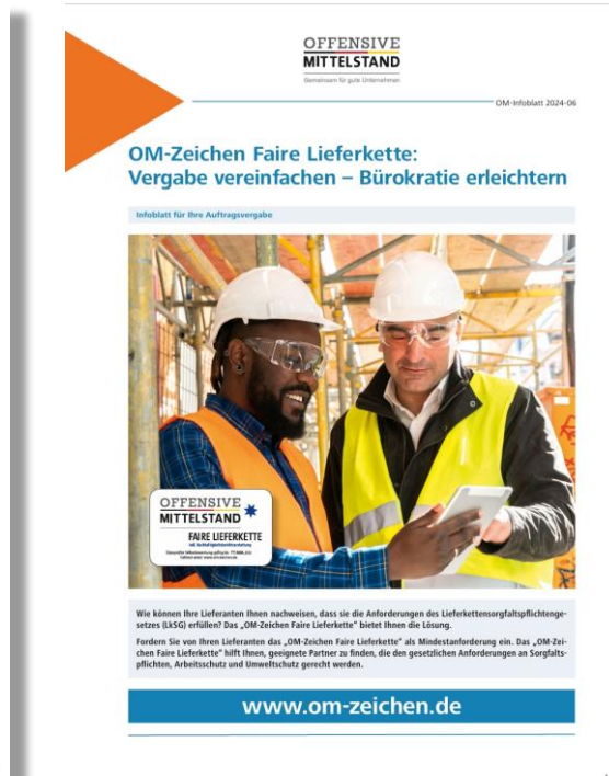
Infoblatt für Einkaufsstellen der Auftraggeber

► Alle Infoblätter stehen PDF zum Download auf der OM-Website zur Verfügung