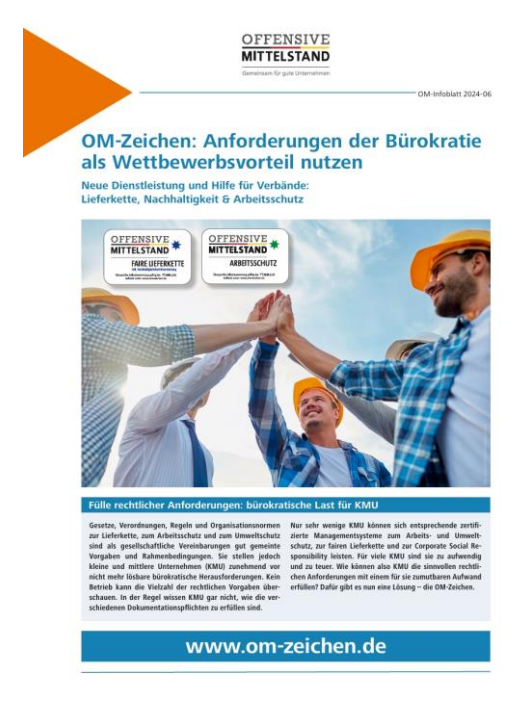
Infoblatt für Verbände

➤ Alle Infoblätter stehen als PDF zum Download auf der OM-Website zur Verfügung: