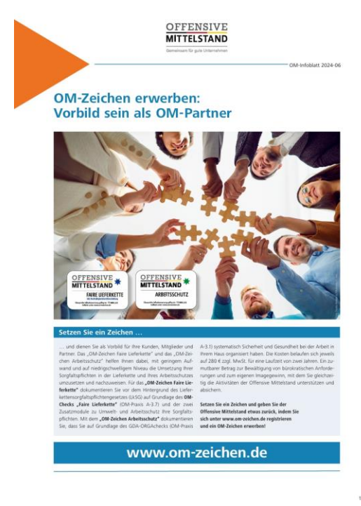
Infoblatt für OM-Partner-Organisationen